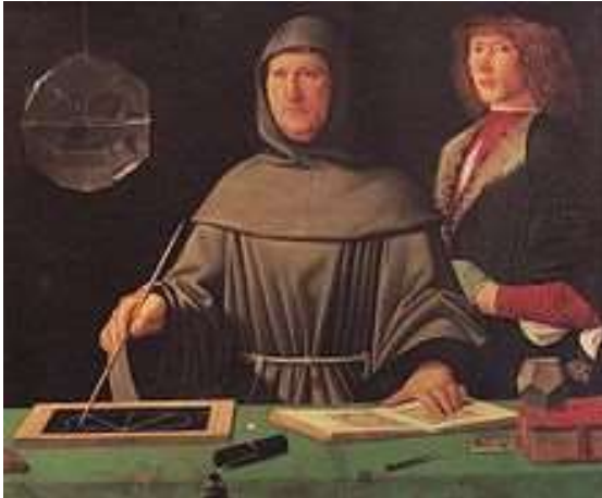
Luca de Pacioli (1445 - 1517)

Nabavka = veće zalihe = veće obaveze ka dobavljaču